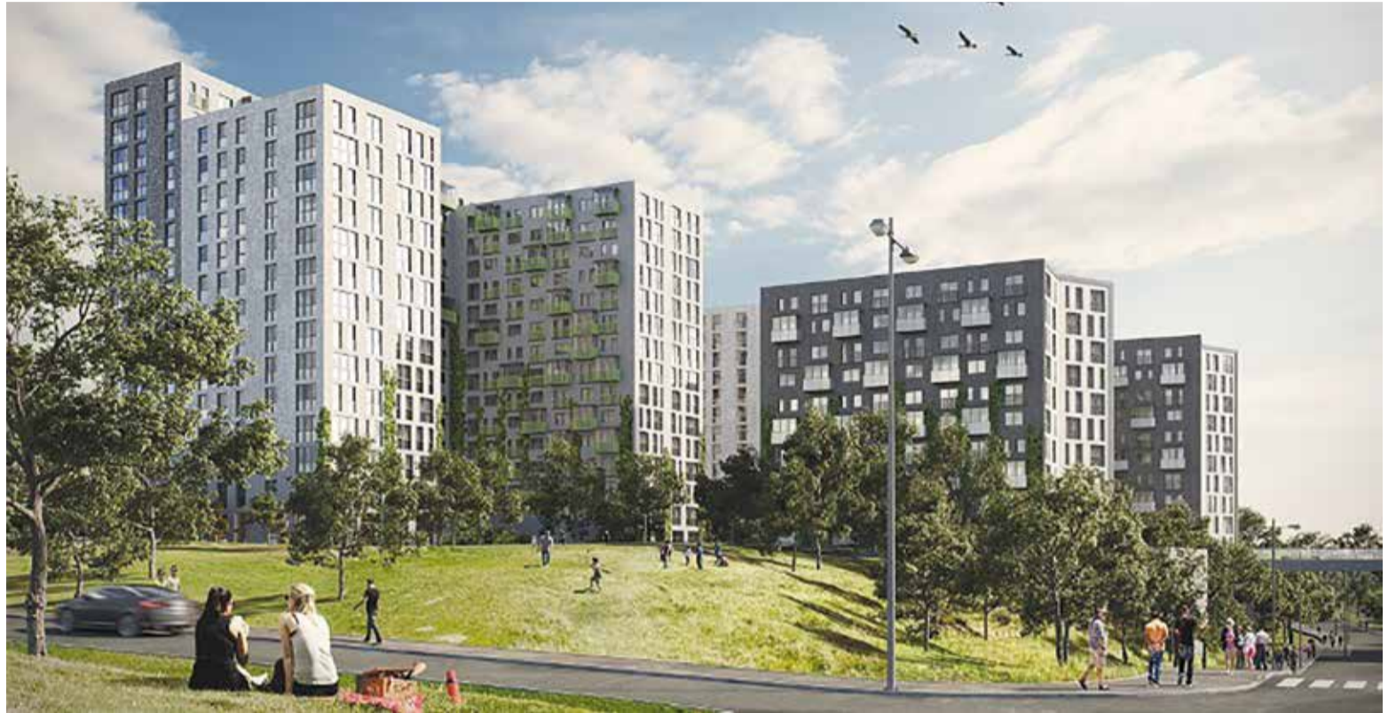
Застройщик ООО СЗ «СтройЭконом». Проектные декларации на сайте наш.дом.рф

Несколько слов о проекте. «Скандинавия» – это жилой комплекс комфорт-класса, расположенный в Октябрьском округе, одном из самых престижных и экологически чистых районов Иркутска с развитой инфраструктурой. Набережная Ангары, вид из окон высоких этажей на реку, близость Байкала (всего 40 минут на авто) повышают его уникальность и привлекательность как для местных жителей, так и для инвесторов из любого региона. Концепция комплекса разработана шведским архитектурным бюро Semrén+Månsson. В её основе сдержанный стиль, экологичность, отсутствие кричащих деталей и высокая функциональность архитектур-