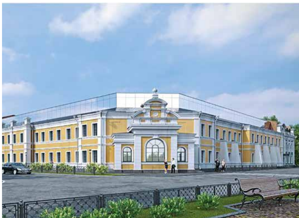
Курбатовские бани, проект