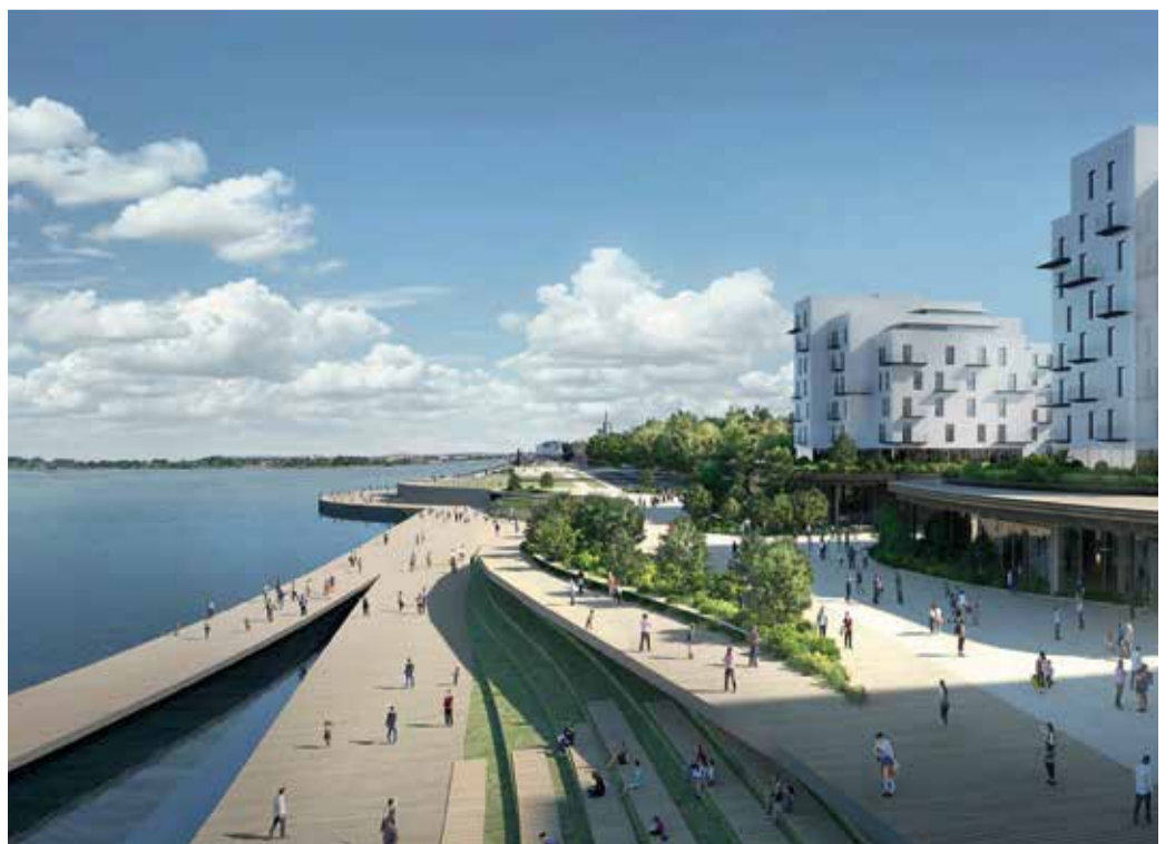
Цесовская набережная, проект